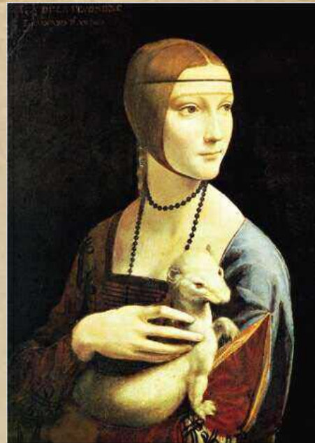
【白貂を抱く貴婦人】 (Ritratto di dama con ermellino) 1485-1490年, 54×39cm, Oil on panel ツァルトリスキー美術館