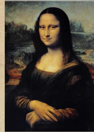
【モナ・リザ】 (Mona Lisa -La Gioconda-) 1503-1505年, 77×53cm, Oil on panel Musee du Louvre, Paris