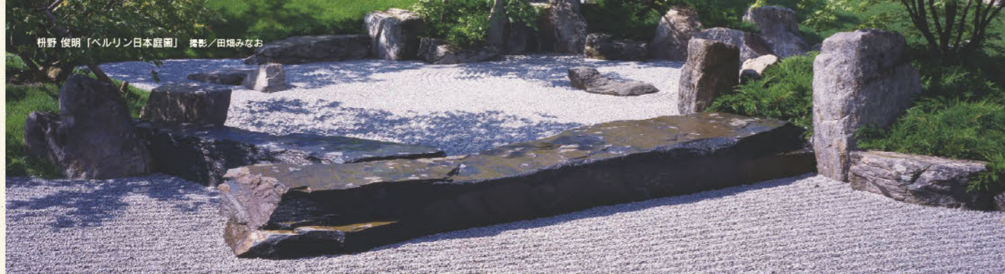
枅野 俊明「ベルリン日本庭園」