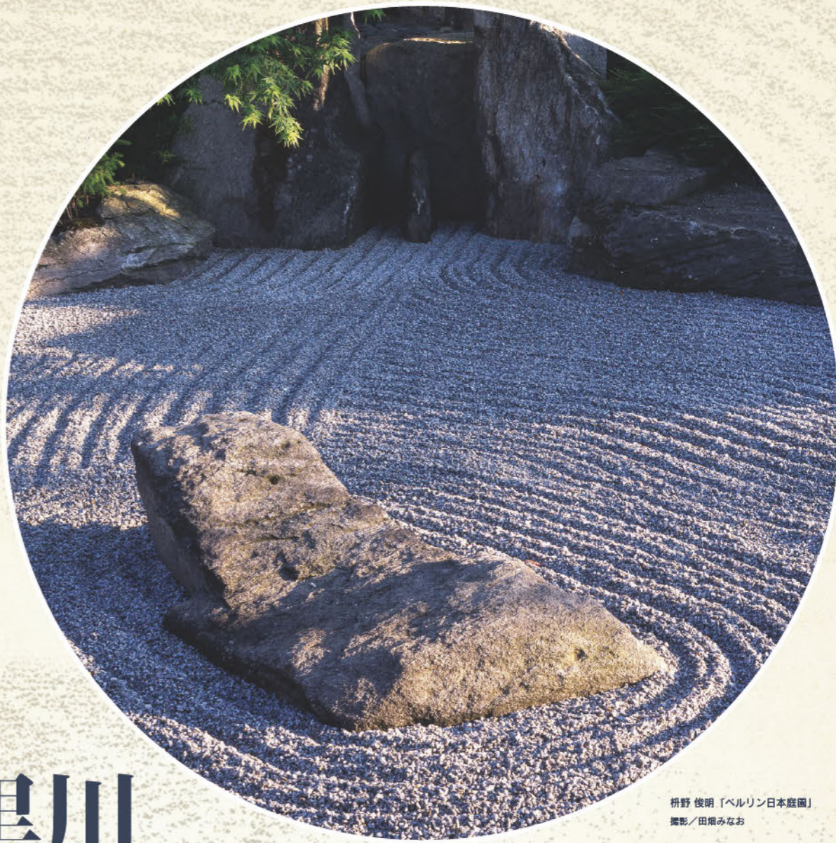
枅野 俊明「ベルリン日本庭園」