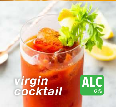
virgin cocktail ALC 0%