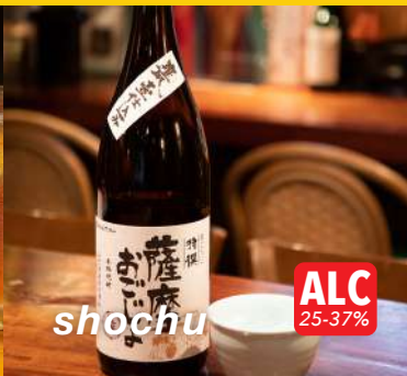
shochu ALC 25-37%