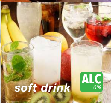
soft drink ALC 0%