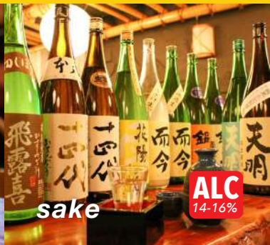
sake ALC 14-16%