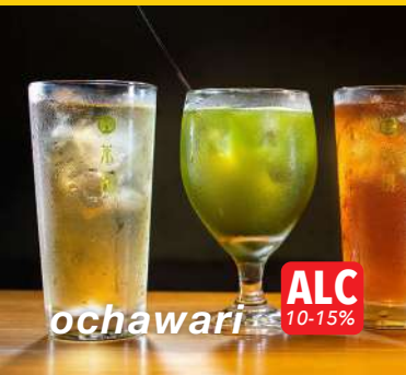
ochawari ALC 10-15%