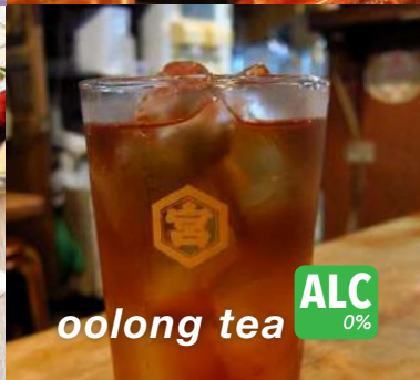
oolong tea ALC 0%