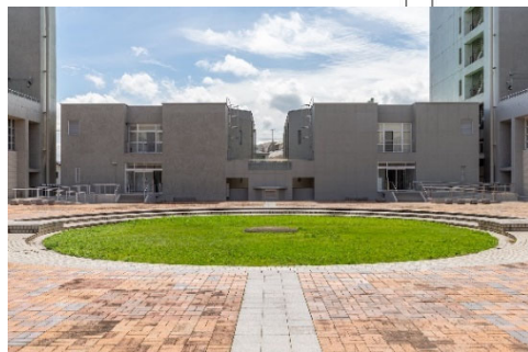
(左) 旧九州芸術工科大学画像特殊施設棟 (九州大学芸術工学部画像特殊棟)

建設：1970年（昭和45年） 設計：香山 壽夫、塚越功、岡道也、橋場光、後藤元一、九州芸術工科大学施設課、K 構造研究所 設備設計：末松設備総合コンサルタント 施工：浅沼組、西松建設