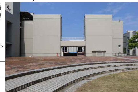
旧九州芸術工科大学工作工房 (九州大学芸術工学部工作工房棟)